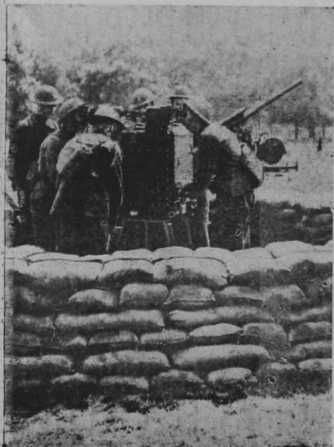
Estos soldados del ejército territorial de Londres, realizando prácticas de cañón anti-aéreo provistos de unos indicadores que hacen el blanco más fácil